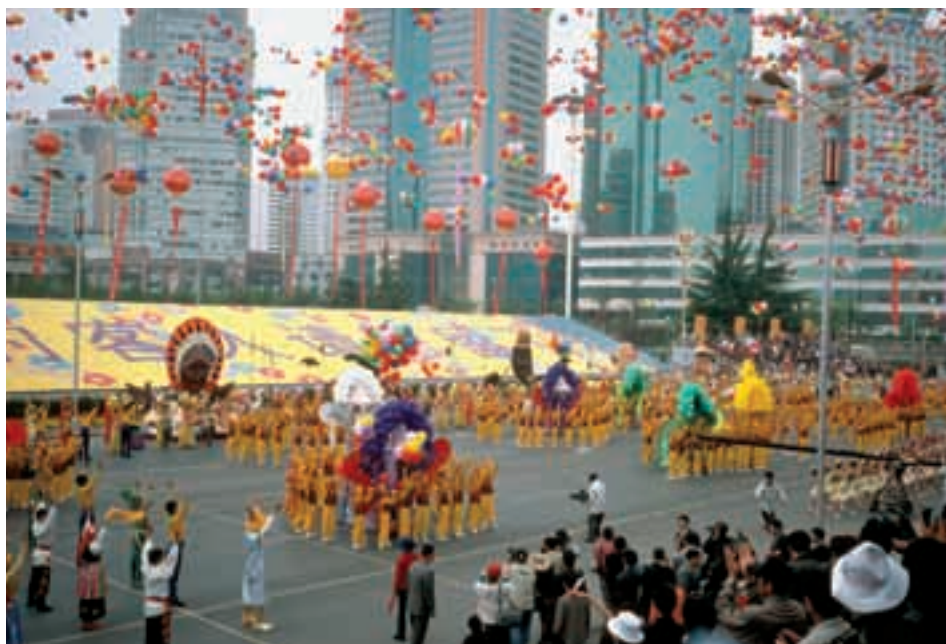
Grande manifestation sur le square Dongfeng, au centre de Kunming.