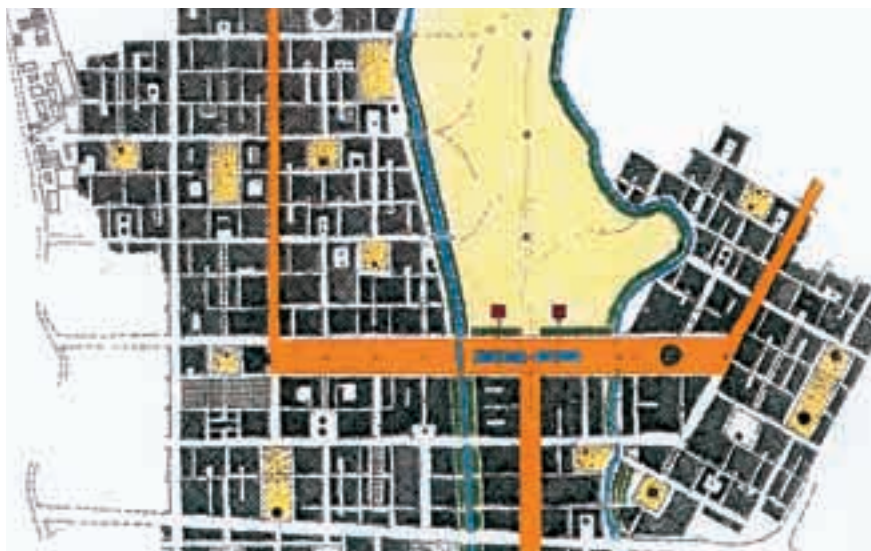
La Beijing Road est l'épine dorsale de la cité actuelle. Le parc proposé à son extrémité (en illustration) figure déjà dans le plan-directeur de la ville de Kunming et sera mentionné lors de l'abornement du nouvel espace bâti.

En 1970, la Zhengyi-Road, l'axe central de la vieille ville, a été reconstruite et élargie. C'est la Beijing Road, qui s'étend de la gare principale, au sud jusqu'à l'extérieur de la ville, au nord, qui constitue la colonne vertébrale de la ville actuelle. La ceinture intérieure fait partie depuis des années de la structure de la ville. La deuxième ceinture, une tangente à plusieurs pistes située au-dessus du niveau de la ville, relie entre eux les axes d'entrée importants et raccorde Kunming aux routes à haute capa-